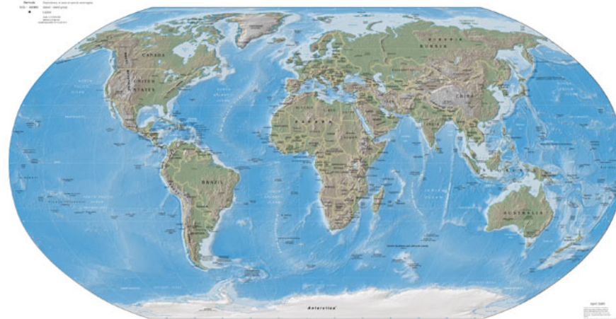
Physical Map of the World, April 2005